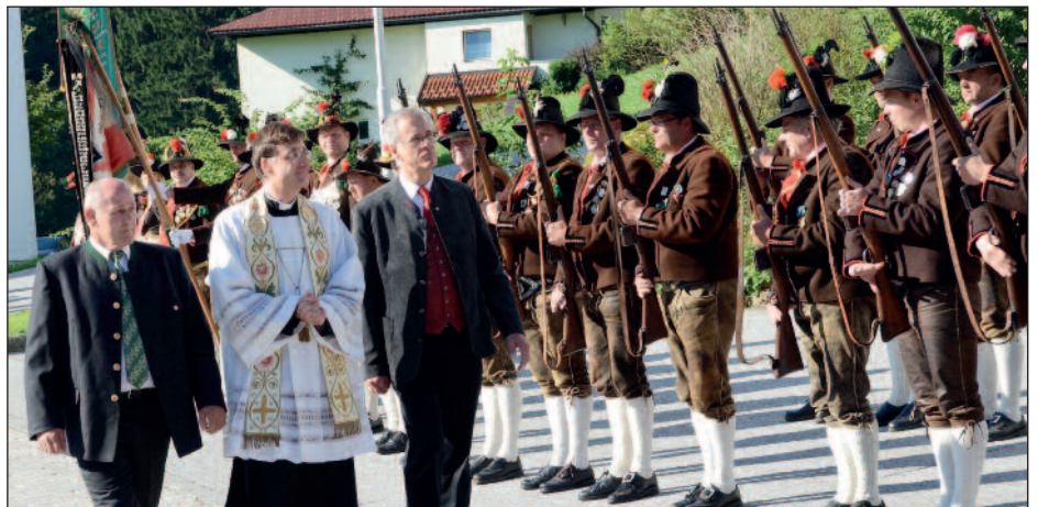
Die Schwoicher Schützenkompanie hatte vor dem Festgottesdienst Aufstellung genommen.